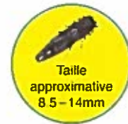
Taille approximative 8.5 – 14mm