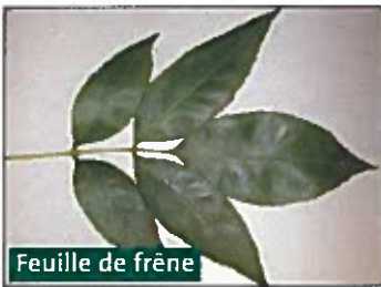
Feuille de frêne