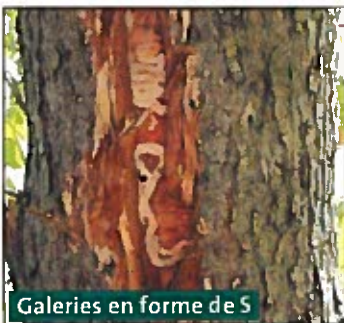
Galeries en forme de S