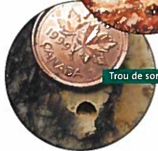
Trou de sortie en forme de D